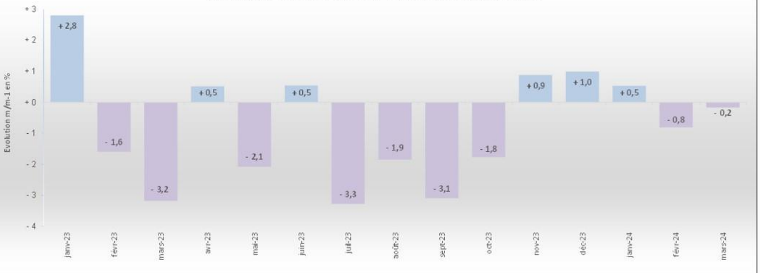
Evolutions mensuelles du carnet de commandes

En revanche, ils restent provisoires pour les deux derniers mois connus : février et mars 2024.