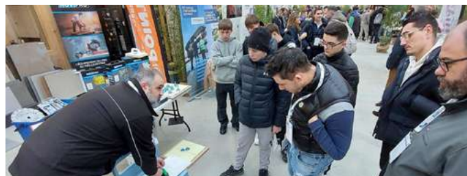
Ateliers pratiques animés par les partenaires