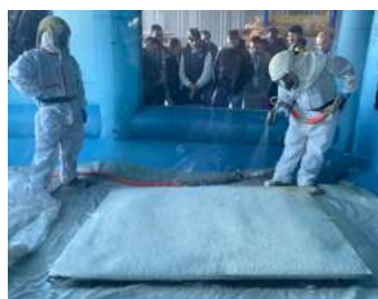
Projection d'un procédé de mousse de polyuréthane de chez Hunstmann.

Les participants ont également assisté à un coulage d'une chape de Lafarge , à base de mousse minérale isolante !