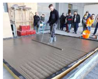
Coulage de la chape Airium à base de mousse minérale isolante.

La table ronde animée par les experts de la SMABTP a permis de préciser les conditions d'assurabilité des chapes, des revêtements carrelés et des isolants en polyuréthane projeté, et les bons réflexes en cas d'expertises.