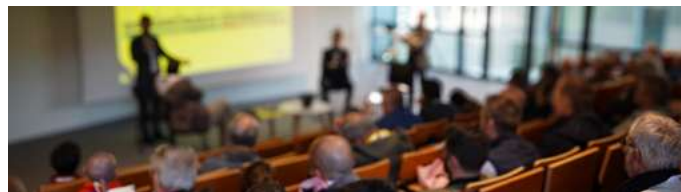
Table ronde animée par la SMABTP.

La table ronde animée par les experts de la SMABTP a permis de préciser les conditions d'assurabilité des chapes, des revêtements carrelés et des isolants en polyuréthane projeté, et les bons réflexes en cas d'expertises.